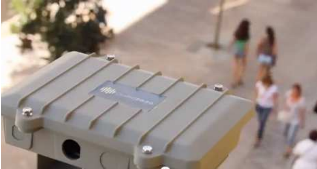
Fig. 2. Caja estanca para la colocación en exteriores del dispositivo de recopilación de datos.