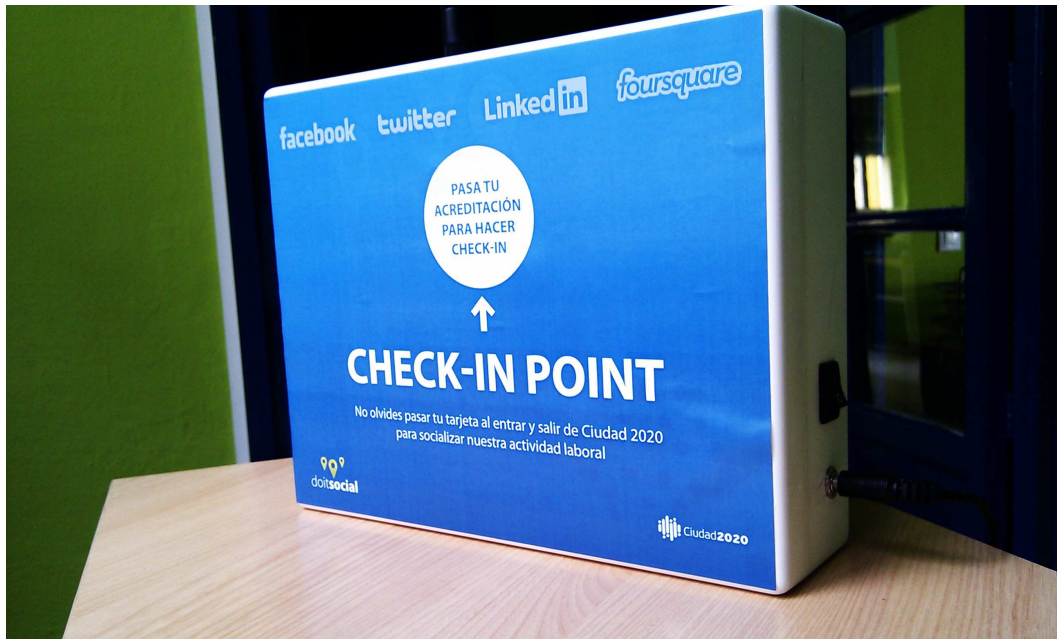
Fig. 4. Configuración de un dispositivo Intelify como check-in point para comunicar la presencia de personas en las principales redes sociales.

mación sobre la movilidad, encargados de enviar la información a los servidores para el posterior procesamiento de la información (ver la Sección IV para más detalles sobre el hardware del dispositivo), y